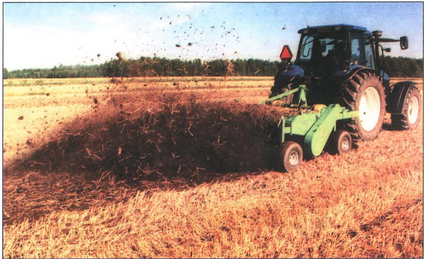
Kultivatoren kastar upp kvickrotten i luften och sedan blir de liggande på ytan och torkar bort.

– Via en ekofortbildning var jag med och ordnade demonstrationer